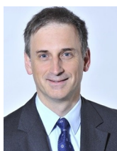
Christian Aebi Premier procureur du canton de Zoug